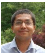
Por Suchith Anand GeoForAll

Si tiene alguna pregunta, envíe un correo electrónico a season-of-docs-support@googlegroups.com .